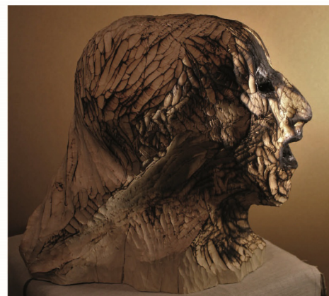
"Inchiostro". Scultura lignea di Marco Dotti

Sono state invitate, ma dopo un primo contatto telefonico si sono dichiarate impossibilitate a partecipare all'iniziativa. Ci auguriamo in futuro di riuscire a coinvolgere anche loro.