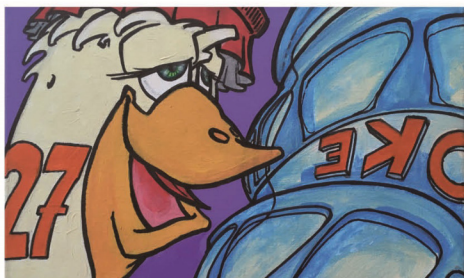
Una delle "caselle" del Gioco dell'Oca di Gattonero